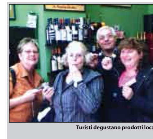
Turisti degustano prodotti locali

D a imprenditore economico debbo dire che l'apertura del Castello Grifeo ha portato a Partanna un flusso di visitatori che hanno contribuito, anche se in modo poco visibile, ad incrementare l'economia. Personalmente, ho creduto da sempre nella fruizione del Castello Grifeo ed ho atteso da nove anni tale apertura; da qualche mese ho pure aperto un secondo punto vendita proprio nelle vicinanze del "Grifeo". Sono venuti tanti visitatori, ma la maggioranza si è limitata solo alla visita del Castello ed è andata subito via, una piccola percentuale ha visitato anche la Chiesa Madre, ma sono veramente pochi coloro che hanno fatto una passeggiata nel centro storico. I più assidui sono stati dei gruppi di tedeschi, accompagnati dalle guide, che oltre a visitare i due monumenti vicini,