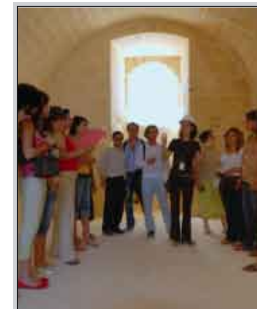
I Corsisti al lavoro a Malta