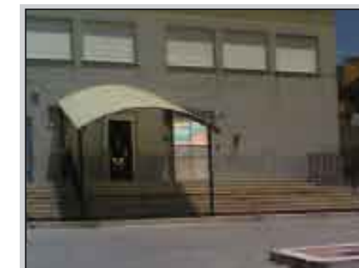
La guardia medica di Partanna

scuna Azienda U.S.L. nell'anno 2007. Di conseguenza la Direzione dell'Azienda U.S.L. n° 9 di Trapani ha deciso di attivare per il periodo 1° Luglio/15 Settembre 2008 le seguenti Guardie Mediche Turistiche: San Vito lo Capo, Marausa Lido, Marettimo, Marsala Litorale Sud (presso Tiburon Beach), Mazara Tonnarelle, Triscina, Tre Fontane, Alcamo Marina, Scopello, Castellammare del Golfo. Tali Guardie Mediche Turistiche osserveranno orario di apertura diurno (dalle ore 8,00 alle ore 20,00) ad eccezione di quelle di Mazara Tonnarelle e Tre Fontane che osserveranno orario continuato 24 ore su 24. La Direzione dell'Azienda U.S.L. n° 9 ha deciso anche la soppressione di n° 4 presidi di Continuità Assistenziale (Guardie Mediche), sempre