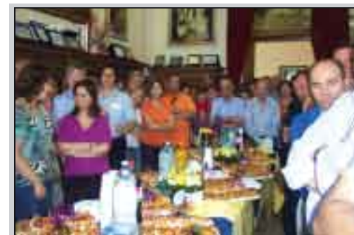
Gli impiegati comunali nel corso della festa del salute